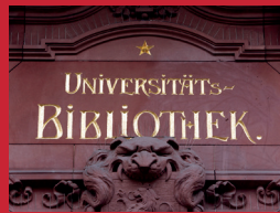
Die Universitätsbibliothek ist in der Altstadt angesiedelt.