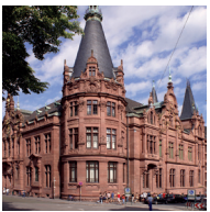
Fassade der Universitätsbibliothek Heidelberg